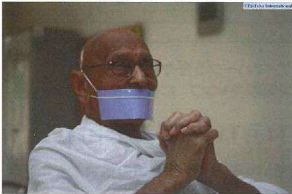
プレクシャ・メディテーションを創った 大聖者アチャリア・マハープラギヤ師