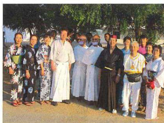
アチャリア・トルシー師生誕100年祭ラトヌーン 2013年