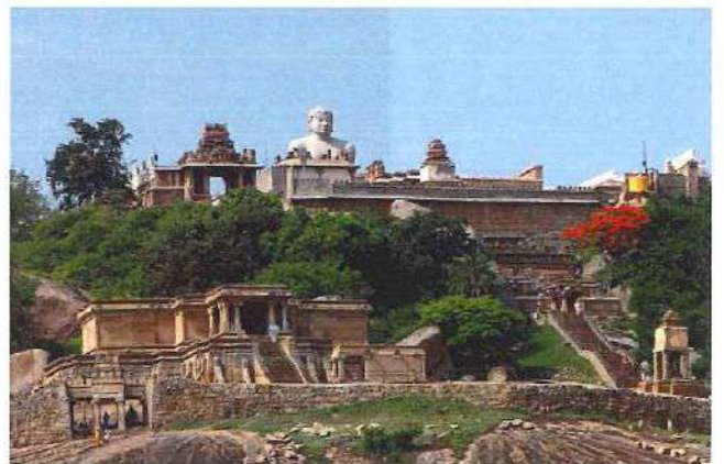
シュラバナベルゴラ遠景

ジャイナ教初代祖師の息子であるゴーマティシュヴァラは、ジャイナ教24聖人のうちの1人で、裸で12年間直立不動のまま瞑想し、その体には蔦が絡んでいたと言われています。12年に一度、この像を清める大きなお祭りが行なわれております。