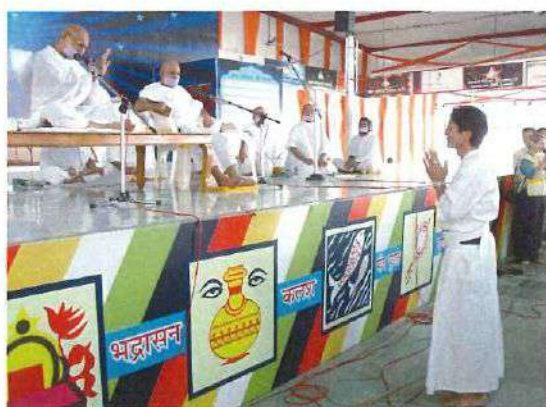
ヴィワニ国際キャンプ 2005年