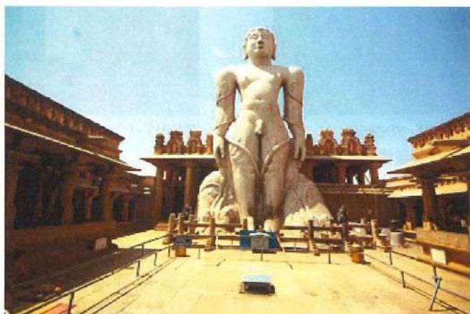
ゴーマティシュヴァラの像