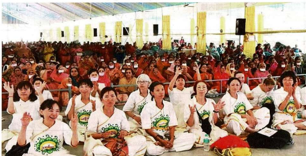
プレクシャ瞑想キャンプのーコマ